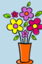
Un vase avec des fleurs