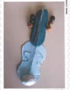
© S. Keskin - école J. Verne (49)

Pablo Picasso a utilisé cette technique dans plusieurs natures mortes . Il y mélangeait la peinture et quelques éléments réels. Il a sans doute été l'un des tout premiers artistes à utiliser le collage. En 1912, dans son tableau intitulé Nature morte à la chaise cannée , il a en effet collé un morceau de toile cirée, dont le motif représente le cannage, les cordes tressées qui forment le fond et le dossier de sa chaise.