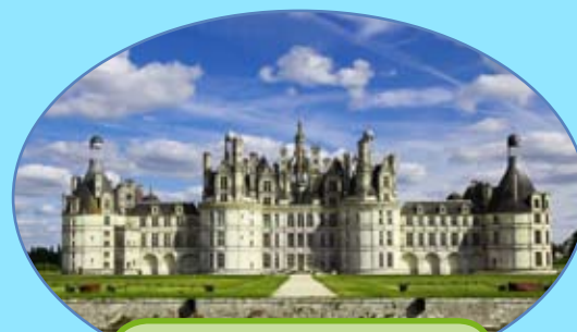
Château de Chambord