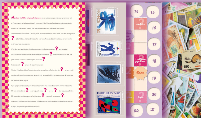
Le timbre fait le texte À la manière de... Plan de jeu Timbres