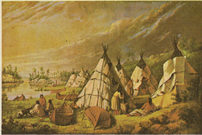
Paul Kane peintre Canada 7